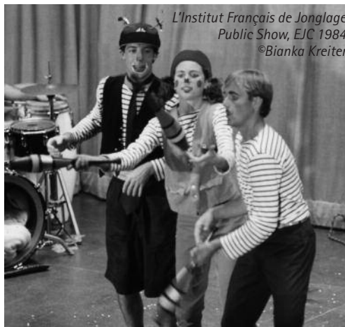
L'Institut Français de Jonglage Public Show, EJC 1984