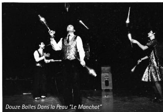
Douze Balles Dans la Peau “Le Manchot”

When they hear about the Institut de Jonglage, they first thought, like many others, that it was a real official institute.