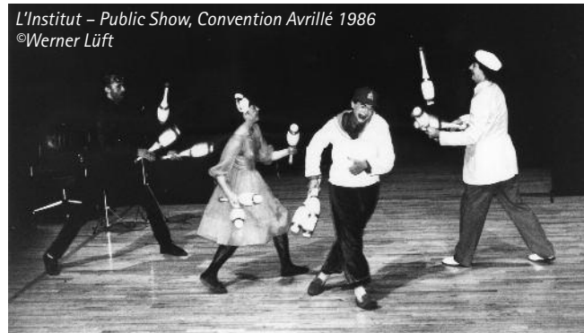
L'Institut – Public Show, Convention Avrillé 1986

The show was essentially burlesque. The first idea was to do a successful and flawless show, where clubs are never dropped and everything flows from beginning to end. But all the potentially comical